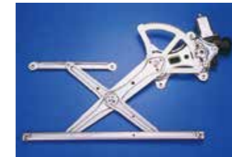
Xアーム式ウインドレギュレータ

上下昇降機能により窓ガラスの上下を調整し、窓を開閉する機能を持っています。Xアーム、シングルアーム、ワイヤー式があります。