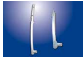
ロアフレーム(鉄・ZAM・アルミ)