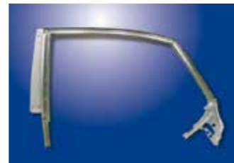
リアドアフレーム(鉄・アルミ)