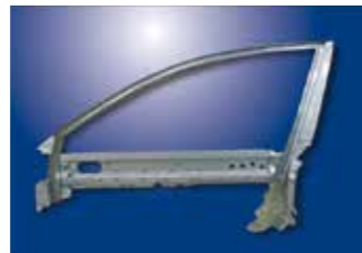
フロントドアフレーム(鉄・アルミ)

ドアが必要とする剛性を確保し、ウインドガラスの保持、走行時の風切り音の低減などの他、水の浸入を防止します。この他ボディー板金属と一体となって車体の骨格を支える重要な機能を持っています。