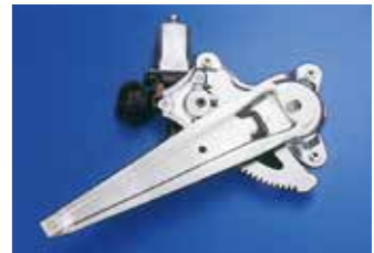
シングルアーム式ウインドレギュレータ