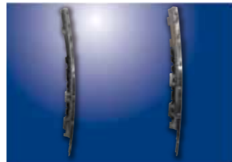
ガラスチャンネル(アルミ)